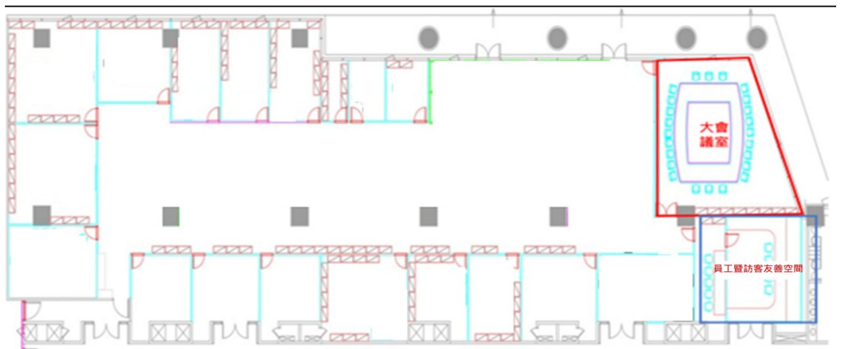
圖 1 施工區域位置圖